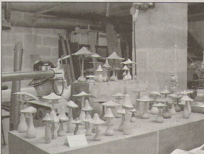
En quelques minutes, Pierre Vanherck transforme un bout de branche de lilas en un petit champignon des bois sous les regards ébahis de dizaines de visiteurs.