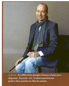
A droite: les différentes gouges (ciseaux à bois) pour dégrossir, façonner, etc. et divers pommeaux prêts à être montés sur fûts de cannes.